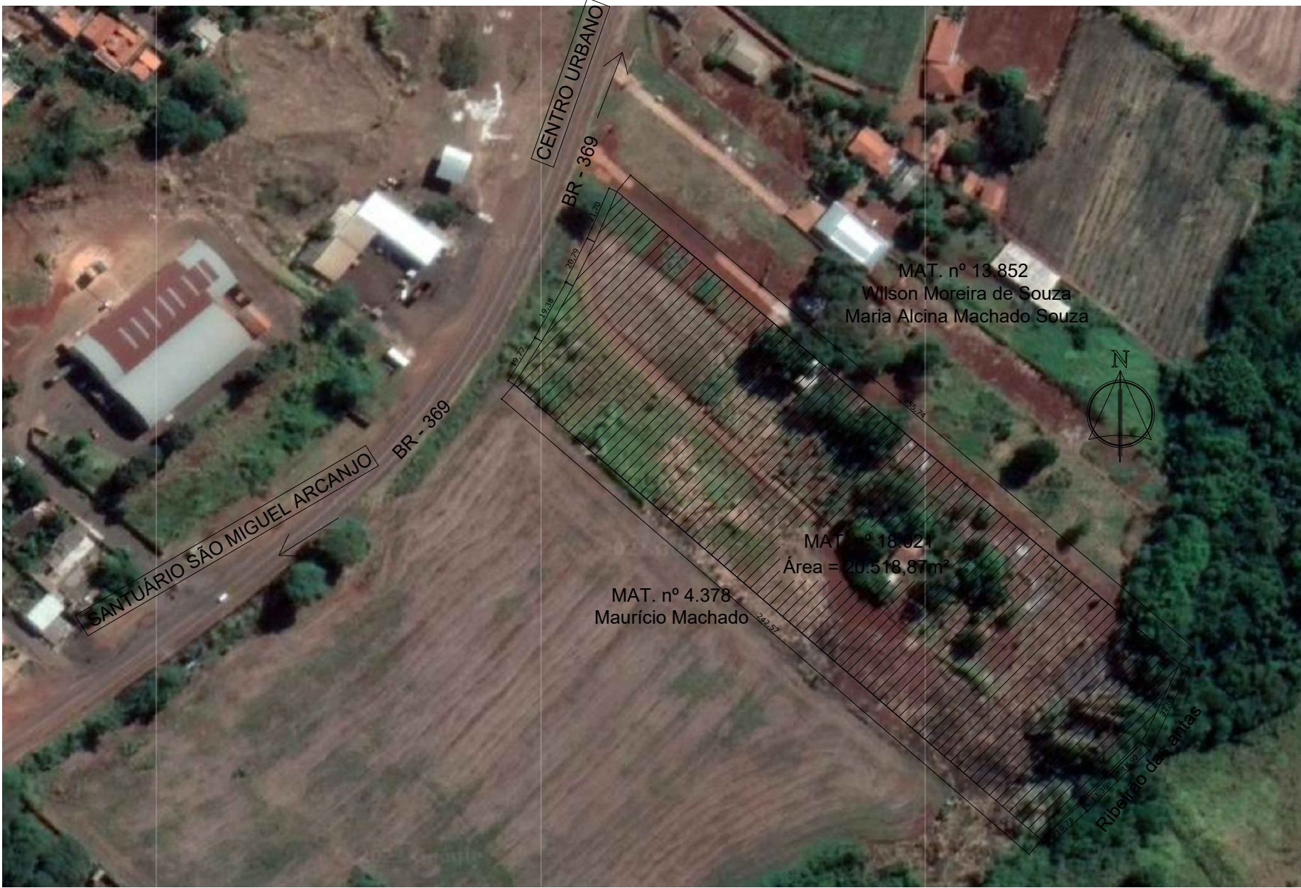
2 IMPLANTAÇÃO ESCALA - 1:2000

TRECHO km: 58+300m Coord: 23° 07' 33,9" S 50° 22' 54,9" W